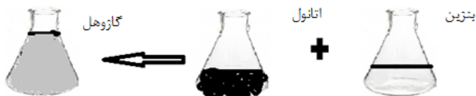
شکل ۳. آمیختن بنزین و اتانول

هرگاه ماده اتانول و بنزین با هم آمیخته شوند، نه تنها ماهیت فیزیکی آن ها تغییر می یابد، بلکه ماهیت شیمیایی آن ها نیز تغییر می کند (استون، ۲۰۱۲) که فرایند آمیختن این دو ماده در شکل ۳ ارائه شده است.