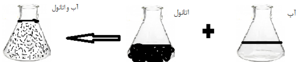
شکل ۲. آمیختن دو ماده آب و اتانول

همان گونه که در شکل ۲ مشاهده می شود، دو ماده آب و اتانول به صورت یکنواخت و همگن در همدیگر آمیخته شده اند و با نمونه گیری از هر بخش از این ظرف مقدار یکسانی آب و اتانول وجود خواهد داشت.