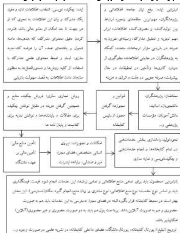
شکل ۳. مدل مفهومی فرایند تجاری‌سازی خدمات چکیده‌نویسی و نمایه‌سازی (با تأکید بر ترتیب و توالی)