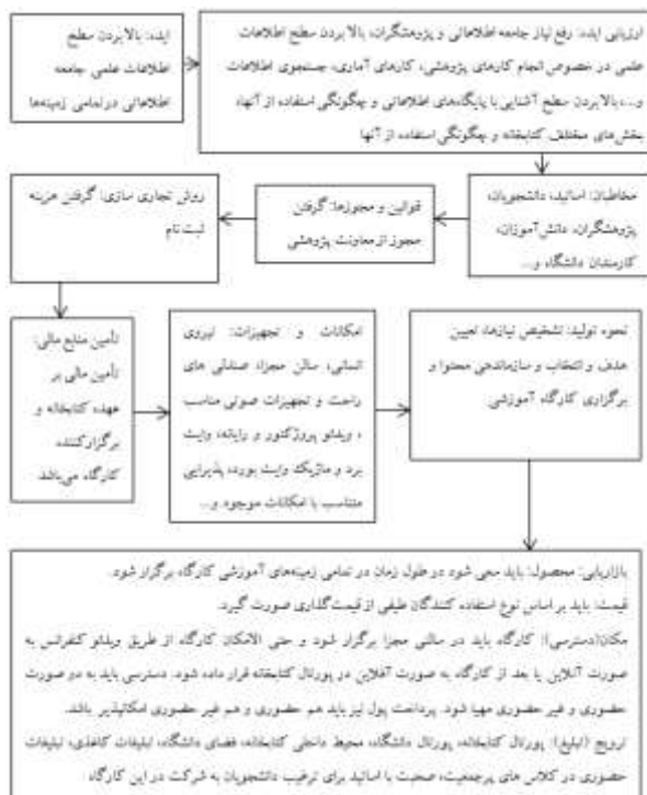
شکل ۲. مدل مفهومی فرایند تجاری‌سازی کارگاه‌های آموزشی (با تأکید بر ترتیب و توالی) خدمات چکیده‌نویسی و نمایه‌سازی